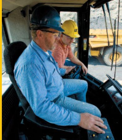
Training am Gerät